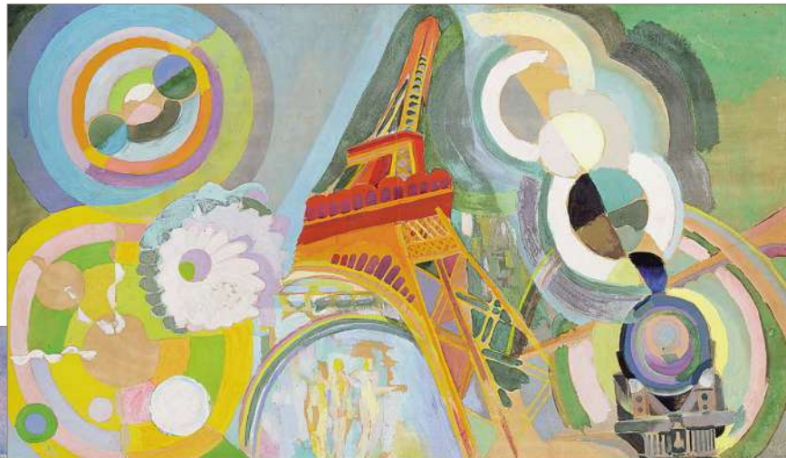
ROBERT DELAUNAY Champ de Mars: la Tour eiffel (detail) 1911-1912, huile sur toile, 160,7 x 126,6 cm Chicago, Art Institute of Chicago (page précédente)