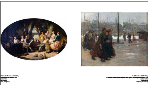
3. Réunion de famille, 1793. Musée de la Ville de Paris, Paris. 4. Rue de la Harpe, 1793. Musée de la Ville de Paris, Paris.