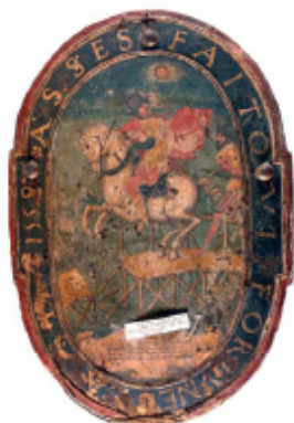
1821. Médaille d'opposition, 1750. Musée de la Ville de Paris, Paris.

On trouve d'abord, par le moyen de l'histoire, une idée de ce que c'est qu'une religion, et de ce que c'est qu'une religion.