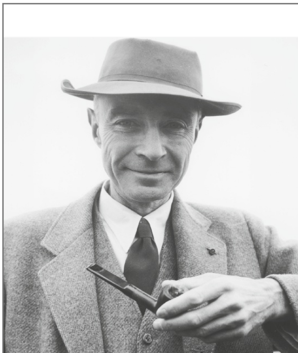
Robert Oppenheimer, un brillant chercheur épris de culture et d'humanisme, mais aussi artisan de la bombe atomique (ici, en 1958).