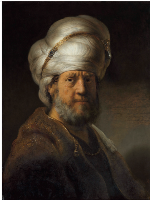
Rembrandt, Homme en vêtements orientaux (1635, huile sur panneau, 72 x 154,5 cm, Amsterdam, Rijksmuseum).