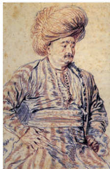
Antoine Watteau, Persan assis (1715, sanguine et pierre noire sur papier jauni, 30 x 19,8 cm, Paris, musée du Louvre).

derrière le souverain, deux hommes portent tapis et oreillers qui lui sont destinés si l'appel à la prière intervient durant la solennité.