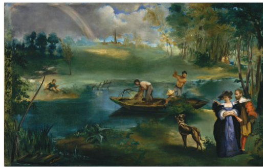
Pêche, 1863-1863 Huile sur toile, 77 x 123 cm Metropolitan Museum of Art, New York