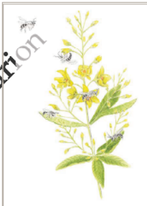
Les fleurs de la famille des Brassicaceae

Les fleurs de la famille des Brassicaceae sont caractérisées par leur corolle à quatre lobes et leur fruit à deux valves. Elles sont souvent accompagnées de pétales et de sépales. Les fleurs de cette famille sont très variées en couleur et en forme. Elles peuvent être simples ou doubles, et elles peuvent être parfumées ou non. Les fleurs de cette famille sont très importantes pour les insectes, qui les utilisent comme source de nourriture et de pollen.